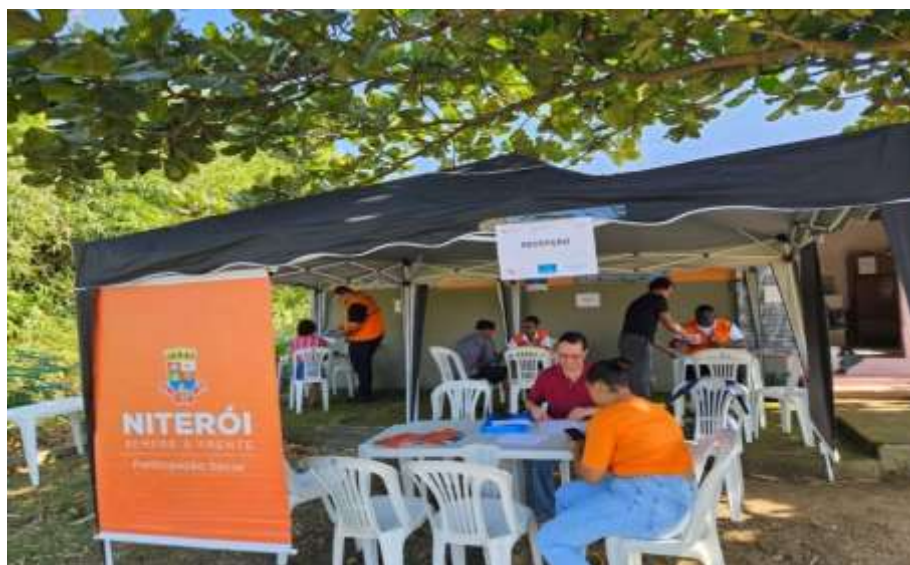
Figura 8 – Escritório Social – versão itinerante

O projeto já foi a 16 bairros de Niterói/RJ e desde 2021 foram realizados 14 cursos.