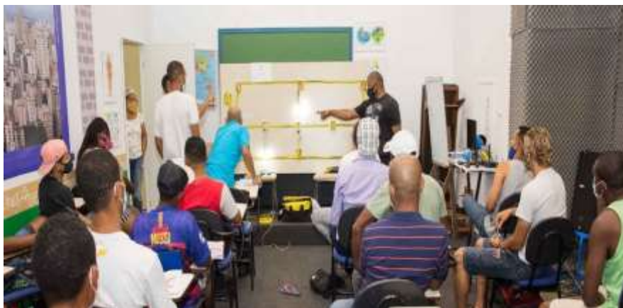
Figura 7 – Aula do Programa de Inclusão Social de Egressos do Sistema Prisional (PrEsp)

Segundo dados da Secretaria de Estado de Justiça e Segurança Pública de Minas Gerais – SEJUSP (2024), o serviço é prestado nos Centros de Prevenção à Criminalidade situados nos Municípios de Ribeirão das Neves, Uberlândia, Uberaba, Montes Claros, Juiz de Fora, Betim, Governador Valadares, Ipatinga, Contagem, Santa Luzia e Belo Horizonte.