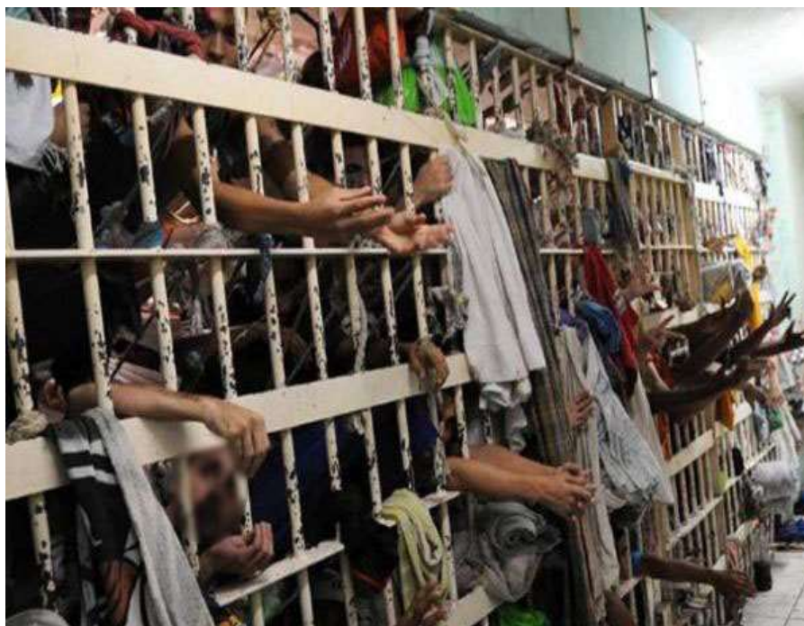
Figura 6 – Instituto Penal Plácido de Sá Carvalho/RJ