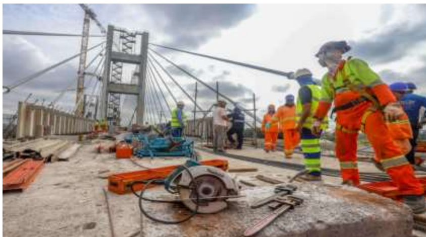
Figura 11 – Egressos trabalhando em obra pública em São Paulo/SP