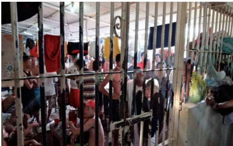
Figura 5 – Centro Penitenciário Professor Aníbal Bruno - Complexo de Curado de Recife/PE.

No entanto, apesar de a decisão da Corte IDH ter sido publicada em 2018, o Estado de Pernambuco ainda não havia cumprido as determinações. Por essa razão, o STF determinou o imediato cumprimento da decisão da Corte, com a fixação de prazo de 30 dias para realização do exame criminológico e aplicação da compensação de pena (MC no HC 208.337).