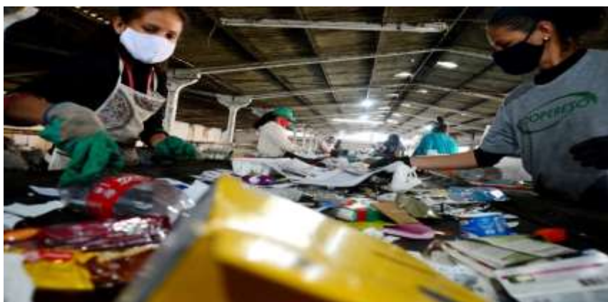
Figura 12 – Reciclagem de materiais coletados em Sorocaba/SP

Atualmente são 170 cooperados, 75% ex-presidiários e 35% familiares. Destes, 60%, são homens; 35%, mulheres; e 5%, LGBTQIA+. Do total, 75% se autodenominam não brancos (negros ou pardos).