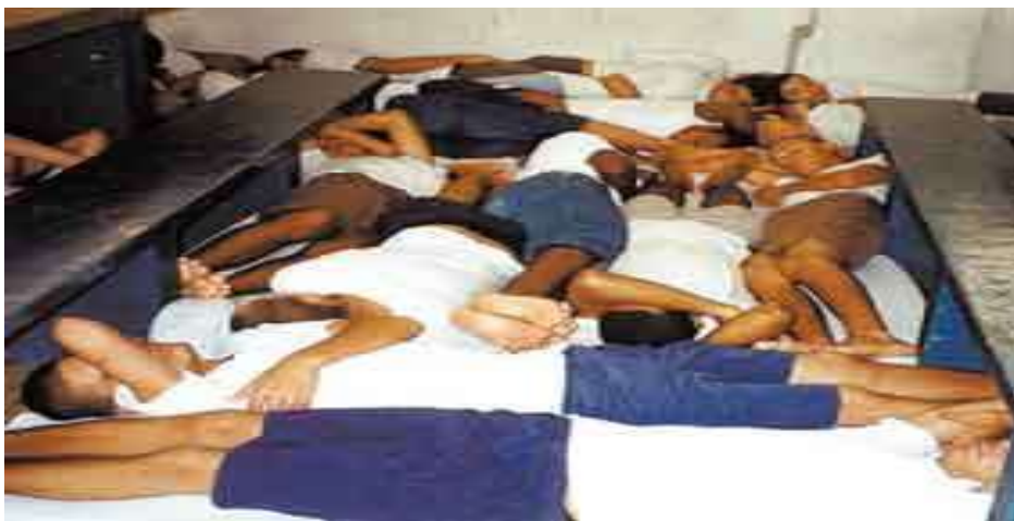
Figura 2 – Complexo do Tatuapé/SP - FEBEM e Fundação Casa.

b) Complexo do Tatuapé/SP - FEBEM e Fundação Casa (Figura 2) - 2005, 2006, 2007 e 2008: em razão das recorrentes ocorrências de violência contra os adolescentes e péssimas condições de instalações na unidade, a Corte Interamericana de Direitos Humanos proferiu medidas para a transferência da totalidade dos beneficiários a outros centros de detenção (Corte IDH, 2008).