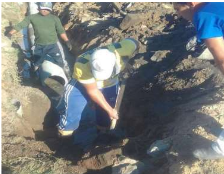
Figura 10 – Egressos trabalhando em obras públicas em Pedro Osório/RS

A ação ganhou o Prêmio Direitos Humanos em 2005, na categoria Defesa dos Direitos Humanos, uma promoção da Assembleia Legislativa do Rio Grande do Sul, em parceria com a Fundação Maurício Sirotsky Sobrinho e com a UNESCO (2023).