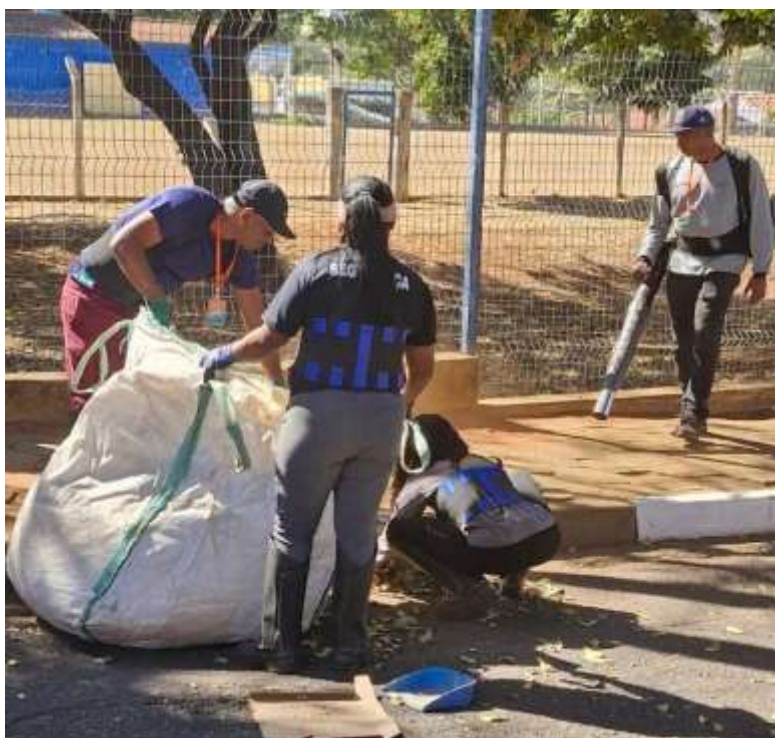
Figura 9 – Limpeza das ruas em Araraquara/SP