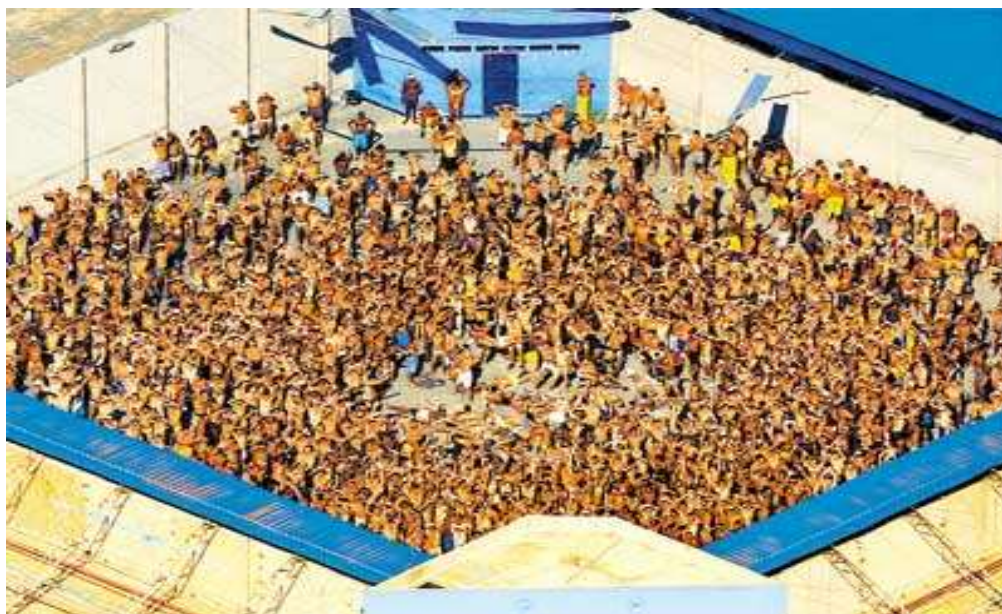
Figura 3 – Penitenciária Dr. Sebastião Martins Silveira, Araraquara/SP.