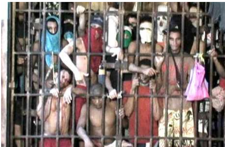
Figura 4 – Complexo de Pedrinhas de São Luiz/MA.