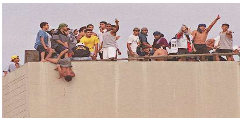
Figura 1 - Penitenciária Urso Branco, de Porto Velho/RO.

a) Penitenciária Urso Branco, de Porto Velho/RO (Figura 1) - 2002, 2004, 2005, 2008, 2009 e 2011: de acordo com a Corte Interamericana de Direitos Humanos, o Estado não cumpriu sua obrigação de proteger a vida e a integridade física dos detentos da Penitenciária Urso Branco, pois não tomou as medidas de segurança necessárias para evitar os assassinatos ocorridos dentro do presídio. As vítimas dos homicídios estavam sob custódia do Estado, portanto, as condições de vida e detenção dos detentos dependem das decisões das autoridades estatais (Corte IDH, 2004).