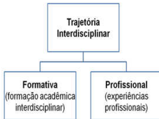
Figura 1. Dimensões formativa e profissional de uma trajetória interdisciplinar.

Optou-se, portanto, pela utilização da metáfora da trajetória. Com essa decisão a análise mantém a coerência com uma visão contemporânea de carreira, com foco nas experiências do indivíduo dentro e fora de organizações, conforme especificada por Sullivan e Baruch (2009). Além disso, agrega a dimensão da formação acadêmica. Em função desta liberdade conceitual, utiliza-se neste capítulo a expressão trajetória interdisciplinar . Neste entendimento, a trajetória interdisciplinar caracteriza as experiências singulares de um indivíduo relacionadas à sua formação acadêmica interdisciplinar e às suas experiências profissionais. A trajetória interdisciplinar é formada por duas dimensões complementares: a dimensão formativa e a dimensão profissional (Figura 1).